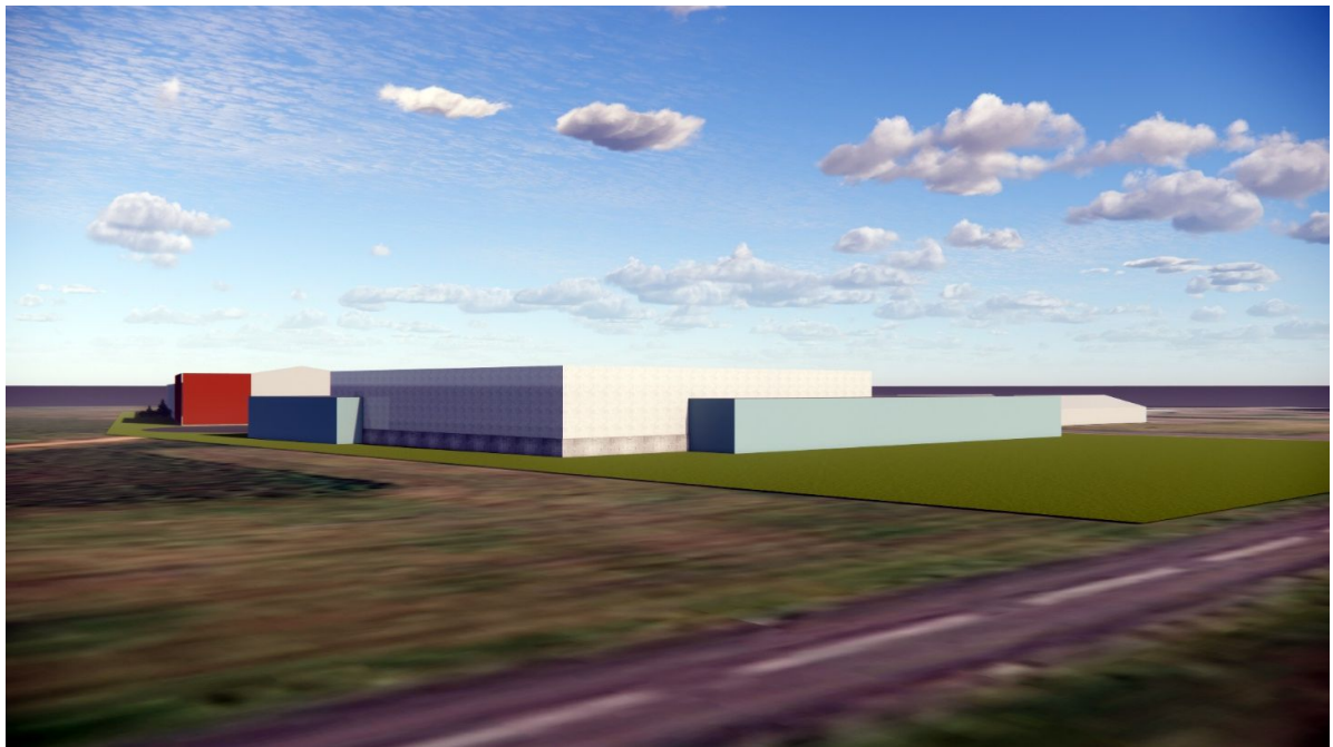
Suðurvesturásýnd frá Hafnarbraut