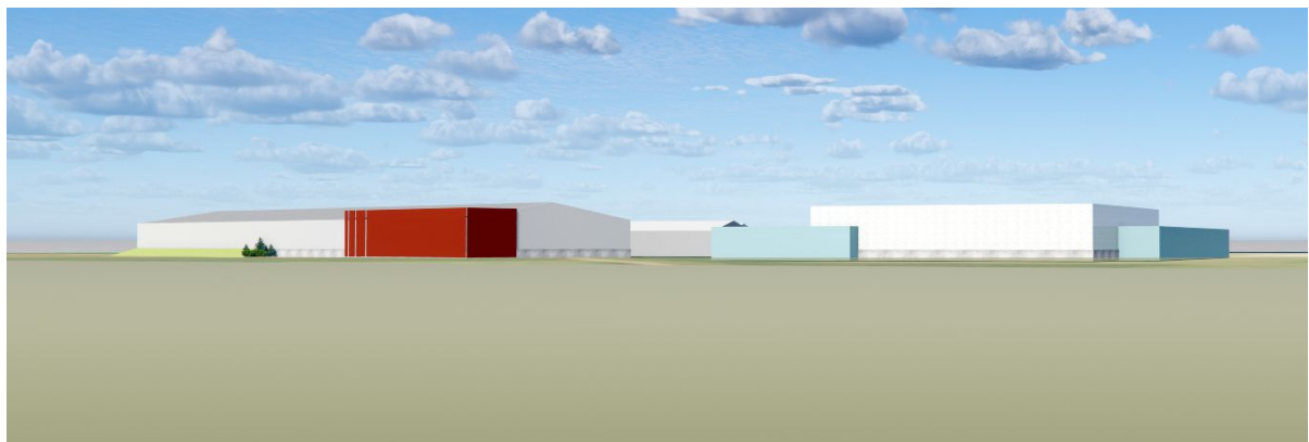
Ásýnd frá Árskógssandsvegi