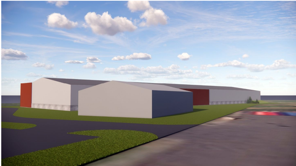
Suðurásýnd frá Öldugötu