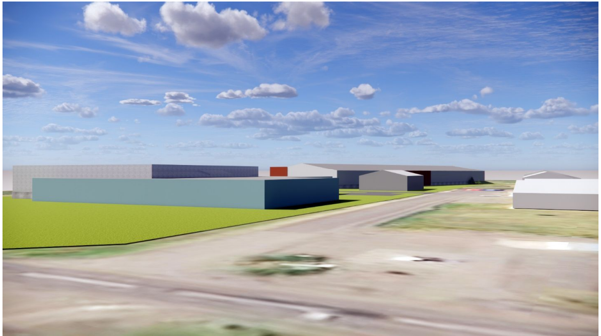
Suðurásýnd frá Hafnarbraut