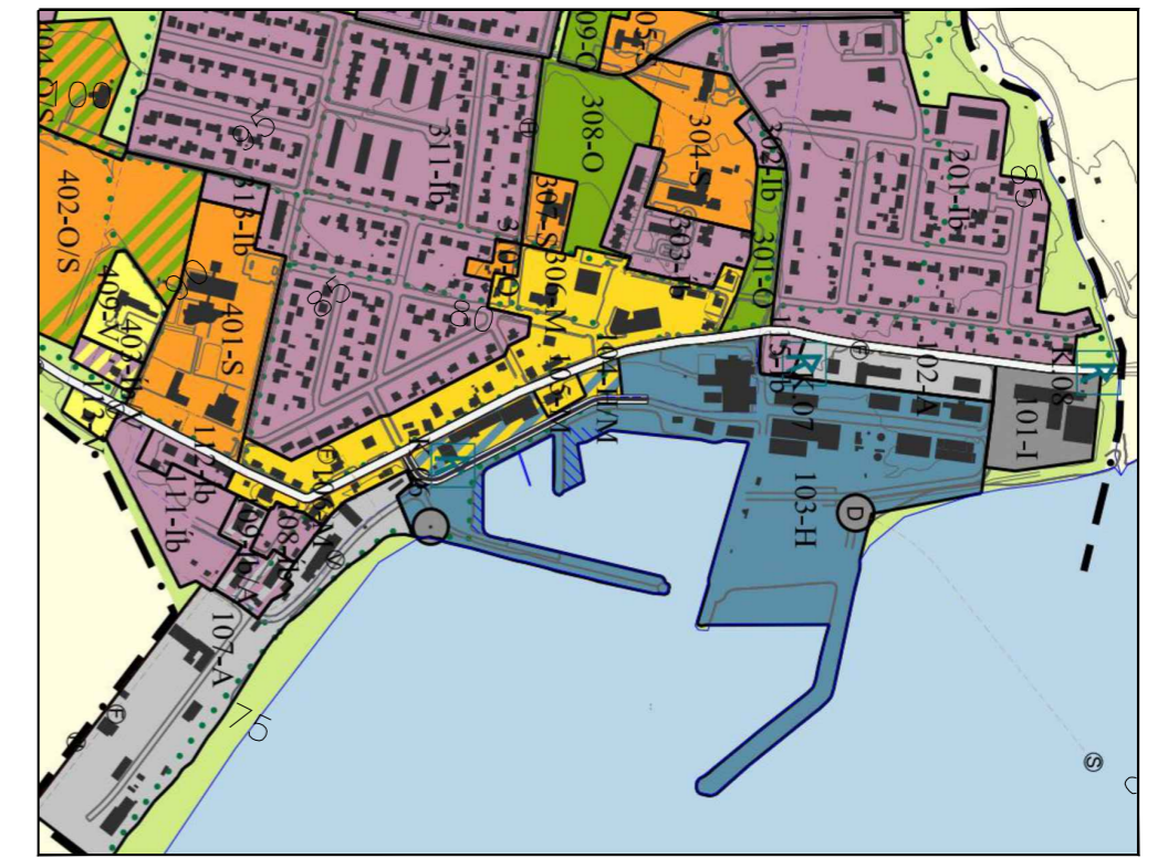
Aðalskipulag Dalvíkur 2008 - 2020 - mkv. 1:10.000