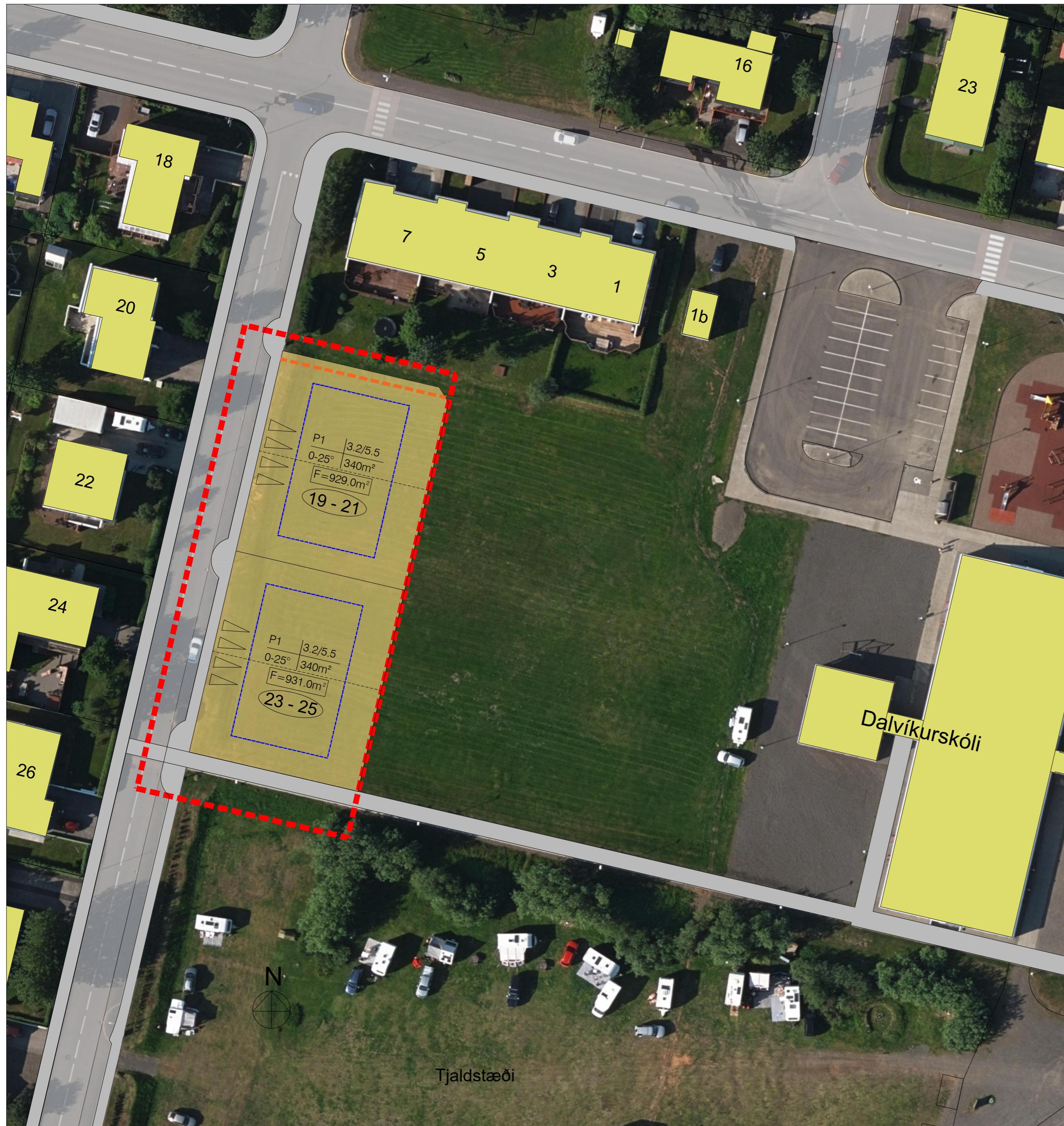
Deiliskipulag - afstöðumynd - mkv. 1:500