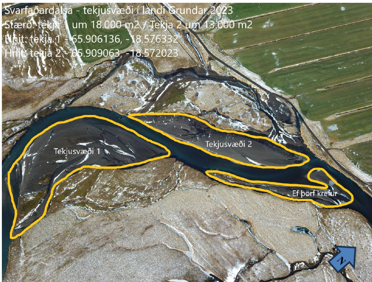
2. mynd. Fyrirhuguð efnisnáma afmörkuð á loftmynd. Mynd úr umsókn.