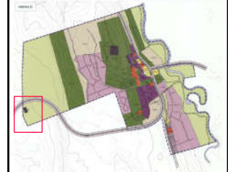
Úr Aðalskipulagi Sveitarfélagsins Skagafjarðar 2009-2021 - Ekki í kvarða