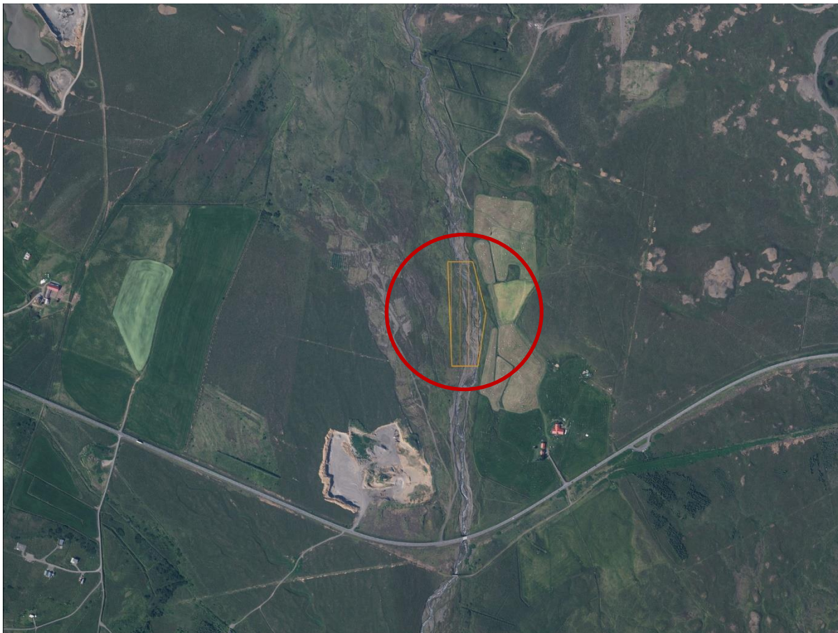
3. mynd. Fyrirhuguð efnisnáma afmörkuð gróflega á loftmynd frá 2019.

Svæðið sem um ræðir teygir sig niður með bökkum Hálsár. Í heildina er það um 24.000 m 2 og gerir framkvæmdaraðili ráð fyrir um 49.000 m 3 malartekju þar næstu 4-5 árin. Þarna verður farið á allt að 3 m dýpi í tekju en þó einungis miðað við 0.5 m dýpt undir vatni. Einhver fiskgengd er í Hálsá en hún hefur ekki verið nýtt til veiðihlunninda. Eins og áður hefur komið fram er meginmarkmið framkvæmda að verja umliggjandi ræktað land og lyngmóa. Einnig er hún hugsuð sem tilraunaverkefni, þannig að farvegur árinna verður breikkaður og myndaðar tjarnir með það að markmiði að koma á búsvæði fyrir sjóbleikju.