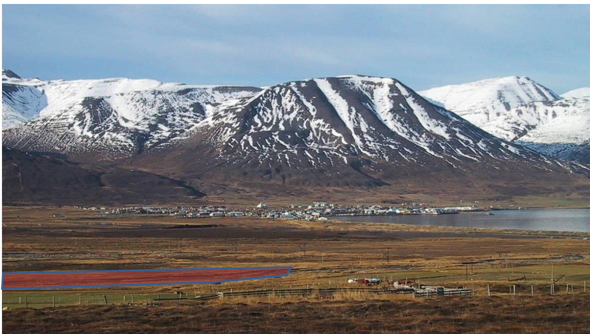
1. mynd. Norðurhluti fyrirhugaðrar efnistöku merktur í grófum dráttum með rauðum fleti. Séð frá Þjóðveginum við minnismerki um séra Friðrik Friðriksson.

Fyrirhuguð breyting á aðalskipulagi felst í því að skilgreina heimild fyrir efnistöku við Hálsá, sem er forsenda framkvæmdaleyfis. Fyrirhuguð efnistaka er um 49.000 m 3 á um 2,4 ha lands á vesturbakka árinna. Efnistökusvæði 2,5 ha eða stærri og/eða 50.000 m 2 eða stærri eru tilkynningarskyld til Skipulagsstofnunar sem úrskurðar um það hvort meta þurfi umhverfisáhrif þeirra. Fyrirhuguð náma er því ekki tilkynningarskyld til Skipulagsstofnunar.