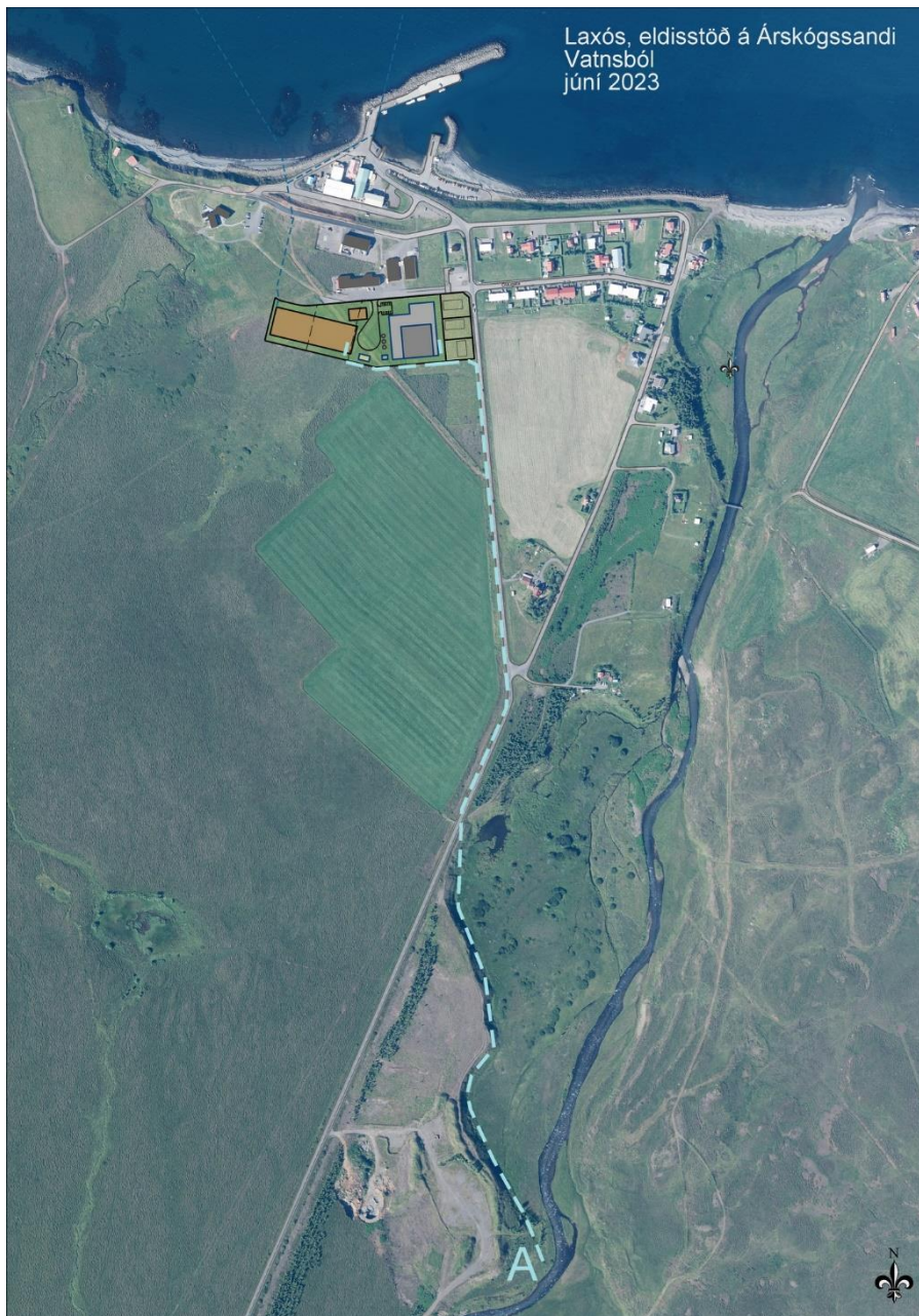
2. mynd. Skýringarmynd. Vatnsból (A) og lögn að eldisstöð.

Vatnsöflunarbrunnur verður grafinn í malareyri vestan árinna, merkt A á mynd 2. Niðurgrafin drenrör leiða vatn, sem síast í gegn um mölina í brunninn. „Allar vatnslagnirnar verða grafnar í jörðu þannig að þær verða ekki sýnilegar og að framkvæmdum loknum verða lítil ummerki um jarðrask. Frágangur á borholum verður líkt og víða er gert, þannig að það fari sem minnst fyrir þeim og þær verði lítið sýnilegar og lokaðar þannig að t.d. yfirborðsvatn og óhreinindi komist ekki inn í lagnirnar. Lögnin frá „A“ yrði ríflega 1.300 m löng en hæð yfir sjávarmáli er u.þ.b. 24 m á þessu svæði. Vonir eru bundnar við að vatnið náist sjálfrennandi, að öllu- eða mestu leyti, frá svæðinu. Við hámarks framleiðslu, 1.200 tonna lífmassa á ári, verður meðal heildar rennsli á ári að hámarki 300 l/sek og hönnun vatnskerfisins mun taka mið af því. Þar af er áætlað að 120 l/sek., verði hreinn sjór og 180 l/sek., verði samtals tekið úr borholum og úr ánni.“